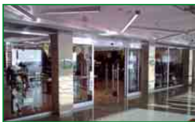
SANTA MARINELLA (RM) Via Aurelia - Km 66,600 - Tel. 0766.535447