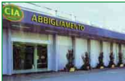
TERNI Via dell'Impresa, 1 - Tel. 0744.800875