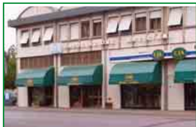
GROSSETO Via Monterosa, 26 - Tel. 0564.450845